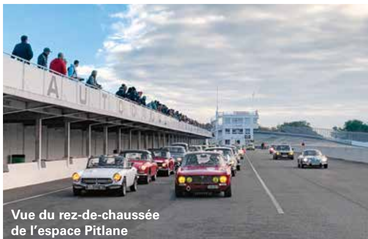
Vue du rez-de-chaussée de l'espace Pitlane

Situé face à la pitlane, cet espace réceptif vous donne accès à une salle de restauration ainsi qu'à une terrasse avec vue sur le circuit et la pitlane